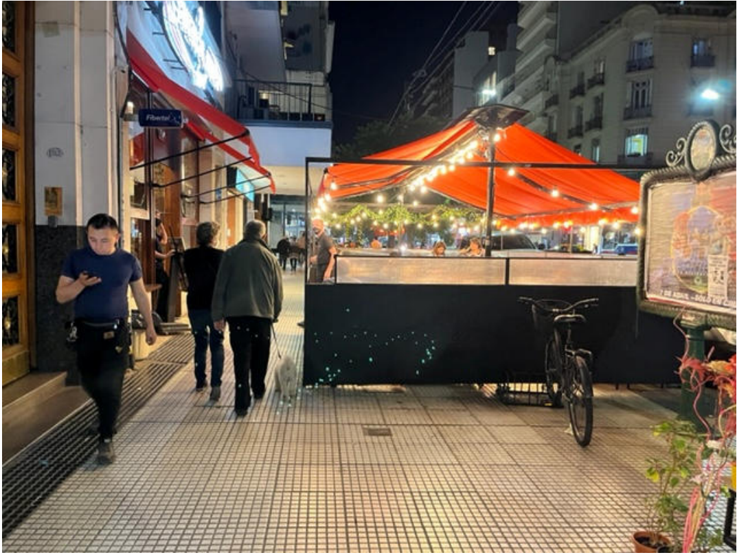
Av. Santa Fe 1876