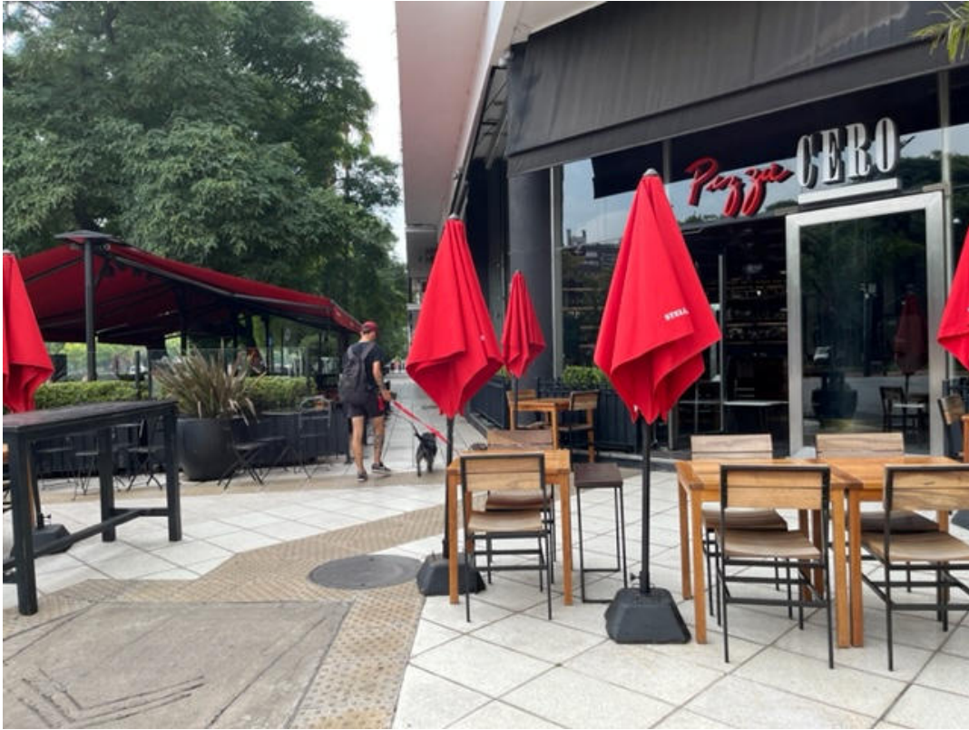
Av del Libertador y Tagle